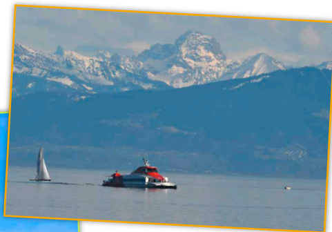
Am Seeufer sind die Alpen immer präsent