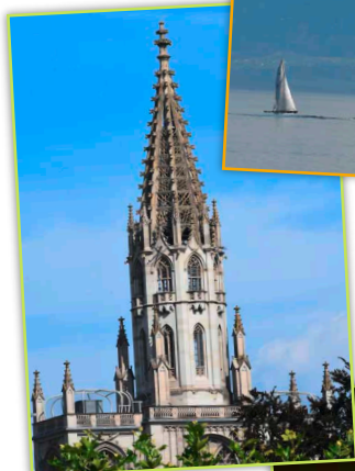
Ein Ort der Freiheit: der Turm des Münsters