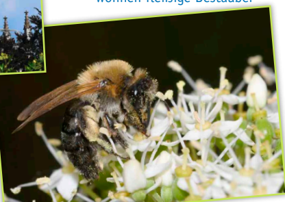
Im Palmenhaus-Park wohnen fleißige Bestäuber