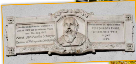
Kunstsprache Volapük – von Konstanz aus in die Welt