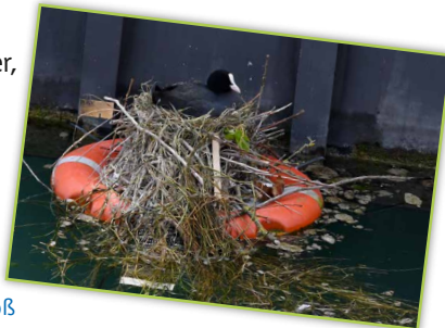
Blässhuhn am Nistfloß

Wir haben uns die größte Mühe gegeben, Standorte auszuwählen, an denen Sie mit größter Wahrscheinlichkeit die angesprochenen Arten auch tatsächlich sehen können. Wenn es mal nicht so sein sollte: Halten Sie die Augen unterwegs offen und Sie werden sicher allen begegnen! Neben den Vögeln unseres Pfades gibt es je nach Jahreszeit auch Grünfinken und Gartenbaumläufer, Kolbenenten, Gänsesäger und vieles mehr zu entdecken!